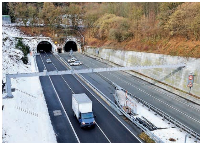
Links fertig, rechts noch nicht: Beim Rugentunnel ist die Südröhre saniert, nun folgen die Nordröhre und die Stützmauer Unspunnen.

Bei der ersten Sanierungsetappe hatte sich gezeigt, dass gewisse Arbeitsschritte bei einzelnen angrenzenden Liegenschaften mehr Lärm verursachten als angenommen. Der Bauablauf wurde deshalb für die zweite Etappe angepasst. Besonders lärmintensive Arbeiten werden nach Möglichkeit von der Nacht in die Tageszeit verlegt. Dies funktioniert jedoch nur in den verkehrsarmen Monaten. In der touristischen Hauptsaison würden die Rückstaus durch die einspurige Verkehrsführung tagsüber zu gross.