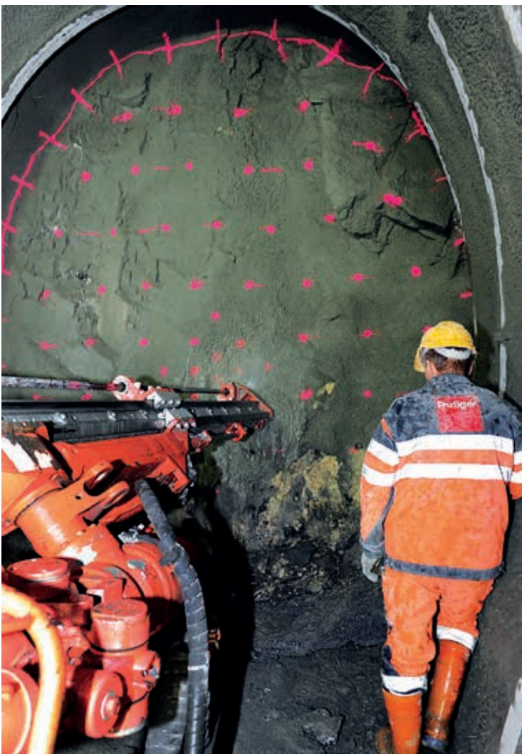
Der letzte Abschnitt des Giessbach-Sicherheitsstollens wird im Sprengvortrieb ausgebrochen: Für die Sprengladungen werden Löcher gebohrt.

Wie in der letzten «info»-Ausgabe bereits berichtet, hat das zerklüftete Gestein beim Ostportal des Giessbachtunnels den Tunnelbauern letzten Sommer erhebliche Schwierigkeiten bereitet. Nachdem die Tunnelbohrmaschine von Westen her über 90% des geplanten Sicherheitsstollens erfolgreich ausgebrochen hatte, blieb sie unerwartet in einer heiklen geologischen Zone stecken.