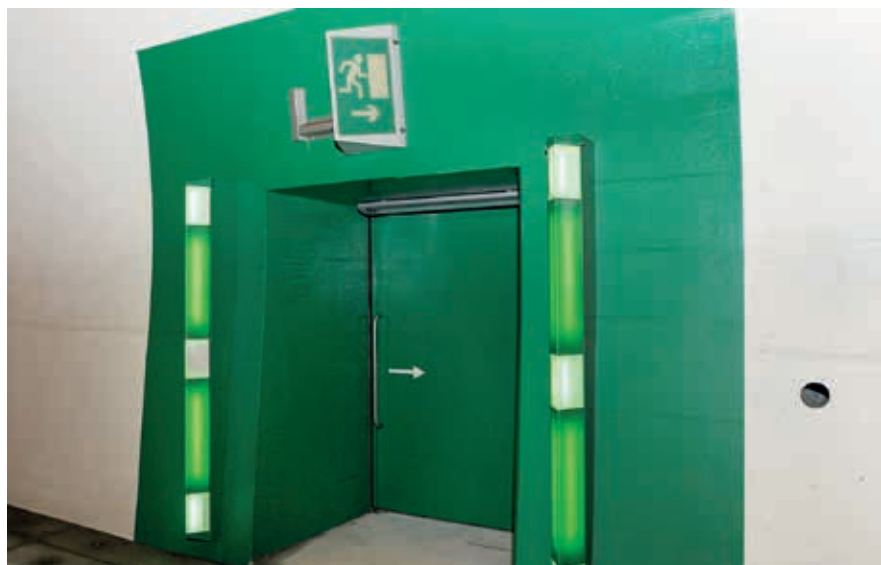
Im Sengg-Tunnel bei Iseltwald: Eingang zum Fluchtstollen

Der Verlauf eines Ereignisses hängt nicht allein von der Strasseninfrastruktur, sondern auch vom Verhalten der betroffenen Fahrzeuginsassen ab. Die unten aufgeführten Punkte sind dabei besonders wichtig.