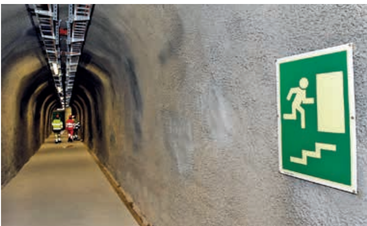
Unterwegs zum nächsten Test: Die Elektromechanik-Experten kehren durch den Fluchtstollen zur Tunnelröhre zurück.

Im weiteren Verlauf der Nacht spielen die BSA-Experten neun zusätzliche Testszenarien durch. Dabei wird etwa auch ein Revisionsbetrieb simuliert: Wartungspersonal soll den Stollen betreten können, ohne dass dadurch bei der Polizei Alarm ausgelöst wird. Am Ende dieser langen Nacht zeigt sich Theo Balmer zufrieden mit den Ergebnissen. Sämtliche Tests sind einwandfrei verlaufen, der Fluchtstollen Sengg kann damit in Betrieb gehen.