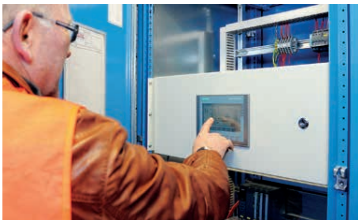
Komplex und robust: Die Steuerung koordiniert sämtliche Funktionen des Sengg-Fluchtstollens.