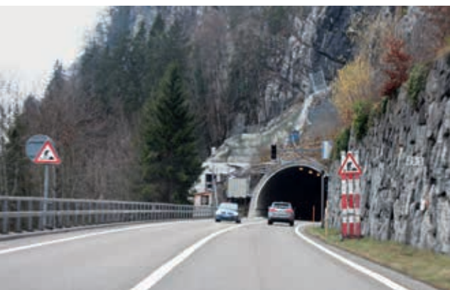
Im Chüebalmtunnel sind Arbeiten im Fahrraum nötig – dies erfordert einige Nachtsperrungen.

Die Arbeiten an den Sicherheitsstollen der Nationalstrassentunnels im Berner Oberland werden so ausgeführt, dass möglichst geringe Auswirkungen auf den Verkehr entstehen. Dennoch sind auch in den kommenden Wochen einige nächtliche Sperrungen unumgänglich.