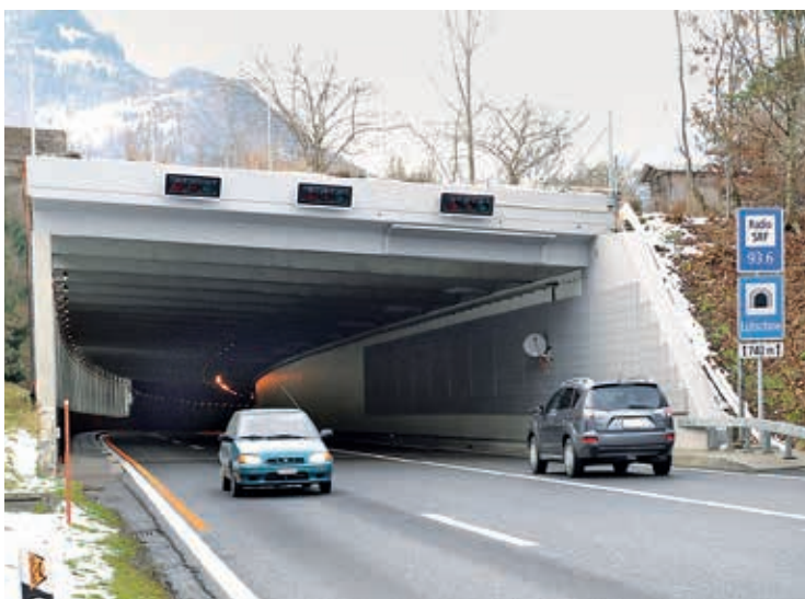
In der Lüttschinenunterführung wird nun die südliche Hälfte (links im Bild) saniert.

In der Lüttschinenunterführung ist die erste Etappe der Instandsetzung Ende 2015 abgeschlossen worden. Die Arbeiten umfassten die nördliche Hälfte der Unterführung. Zudem wurde eine Fluchttreppe bei der Zentrale gebaut. Nach der Winterpause beginnt nun die Sanierung der südlichen Hälfte, weiterhin grösstenteils in Nachtarbeit mit einspuriger, wechselseitiger Verkehrsführung.