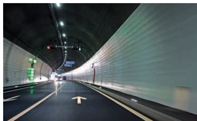
Im Rugentunnel rollt der Verkehr durch die Südöhre.

Im Rugentunnel fliesst der Verkehr weiterhin in beiden Richtungen durch eine Röhre, Sperrungen sind in der nächsten Zeit keine vorgesehen. In der Lüttschinnenunterführung ist seit einigen Tagen wieder die Nachtbaustelle im Gang. Das heisst, tagsüber rollt der Verkehr zweiseitig, nachts einspurig im Wechselverkehr mit Lichtsignalanlage. Voraussichtlich in der zweiten Aprilhälfte sowie in der zweiten Junihälfte 2016 wird die einspurige Verkehrsführung vorübergehend auch tagsüber eingerichtet (siehe Bericht auf Seite 7). Bei starkem Verkehrsaufkommen tagsüber wird der Verkehr manuell geregelt, um die Wartezeiten zu verkürzen.