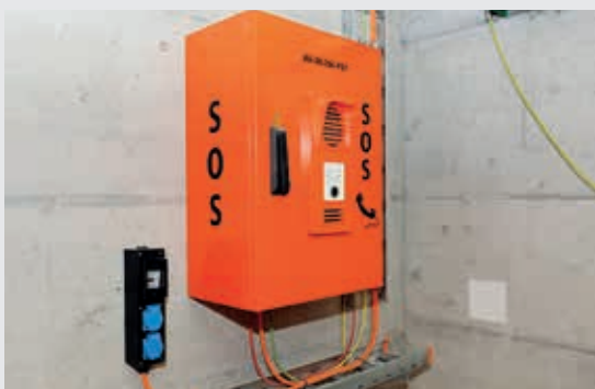
Notruftelefon beim Eingang zum Fluchtstollen