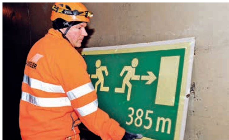
Die alten Hinweistafeln werden entfernt – der neue Fluchtstollen führt zu kürzeren Fluchtwegen.