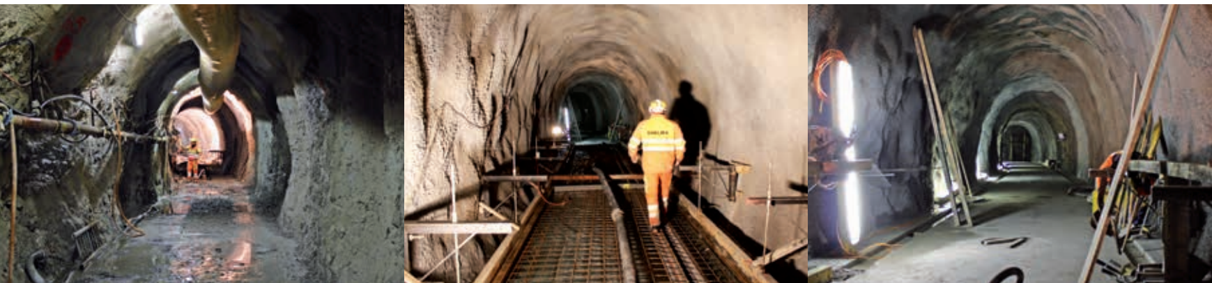
Impressionen vom Innenausbau: Links ist der Stollen noch mehr oder weniger im Rohbau, in der Mitte liegen bereits die Armierungseisen, rechts ist die Sohle des Stollens fertig betoniert. Nun fehlt noch die Betriebs- und Sicherheitsausrüstung.

Im Fluchtstollen für den Simmenfluchtunnel ist derzeit der Innenausbau im Gang. Ab Mai folgt die Installation der Betriebs- und Sicherheitsausrüstung. Der Stollen kann voraussichtlich im August 2016 in Betrieb genommen werden.