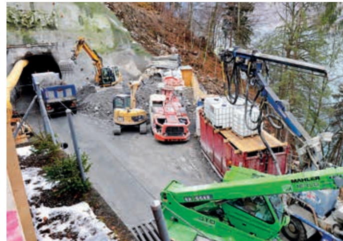
Die engen Platzverhältnisse beim Ostportal des Giessbachtunnels stellen die Bauarbeiter vor grosse Herausforderungen.

Die Projektverantwortlichen entschieden sich in der Folge, beim Ostportal des Giessbachtunnels einen Gegenvortrieb im klassischen Sprengverfahren einzuleiten. Die Arbeiten für den Ausbruch der noch fehlenden 200 Meter des Stollens begannen Ende November. Seither sind die Mineure gut vorangekommen, trotz der ausgesprochen engen Raumverhältnisse beim östlichen Stollenportal. Der Durchschlag des Stollens wird für Anfang April erwartet.